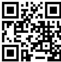
Beispiel des QR-Codes von «eBanking – aber sicher!»

Benutzer können vor dem Einlesen eines QR-Codes in der Regel nicht erkennen, welche Informationen in diesem kodiert wurden. Man sollte deshalb nach Möglichkeit einen QR-Code-Scanner (App) verwenden, der zunächst die decodierten Inhalte anzeigt und nachfragt, ob man etwa einen Link besuchen oder eine bestimmte Aktion ausführen möchte.